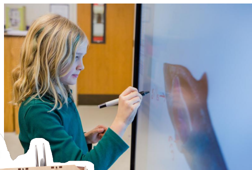
écran tactile 4K