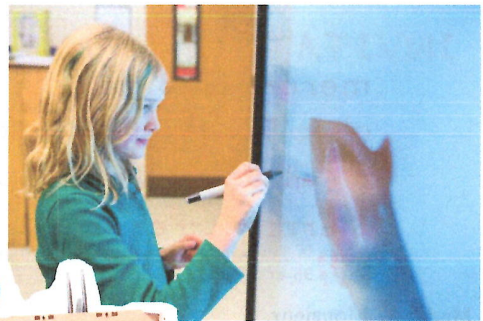
écran tactile 4K